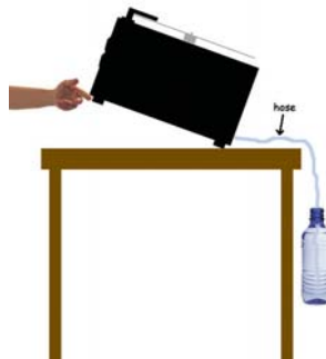
Abbildung 6: Abfließen lassen der Flüssigkeit

Es kann vorkommen, dass - wenn Sie den Abflussbehälter überprüfen - dort nur wenig oder gar keine Flüssigkeit vorhanden ist. Dies kann folgende Ursache haben: Sie verwenden eine Mischung auf Alkoholbasis, die dazu neigt, durch die Wärme, die von der Maschine entsteht, zu verdunsten. Dies ist jedoch keine Entschuldigung dafür, den Behälter nicht nach Reinigung von 30 Schallplatten zu entleeren.