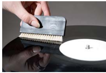
Abbildung 4: Verteilen der Reinigungsflüssigkeit

Lassen Sie die Schallplatte solange drehen, bis alle Rillen mit der Reinigungsflüssigkeit gefüllt sind.