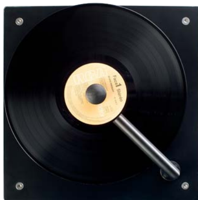
Abbildung 5: Position der Absaugarm während des Vakuum Prozesses

Zwei Umdrehungen sind erforderlich und empfohlen, um die ganze Flüssigkeit abzusaugen – weitere Umdrehungen könnten Ihre Schallplatten beschädigen.